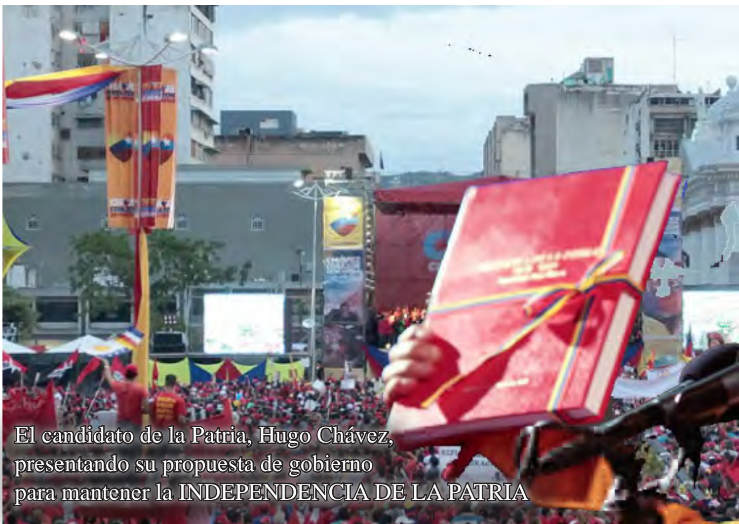
El candidato de la Patria, Hugo Chávez, presentando su propuesta de gobierno para mantener la INDEPENDENCIA DE LA PATRIA

¡Independencia y Patria Socialista! ¡Viviremos y Venceremos!